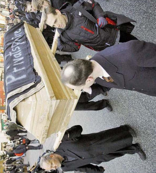
Proteste: Wie in Deutschland (Bild) wird auch in Österreich am Samstag die Privatsphäre von Demonstranten symbolisch zu Grabe getragen